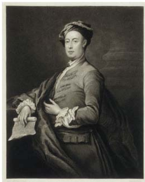
Gravură de Charles Turner după un portret de William Hogarth (aprox. 1720)