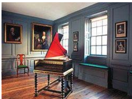
„Casa Händel” din Halle

Contribuția muzicologiei halleze la cunoașterea operelor, problemelor istorice și estetice noi, legate de creația lui Händel, este relativ recentă. Abia după cel de al doilea război mondial cultul marelui compozitor ia proporții ample.